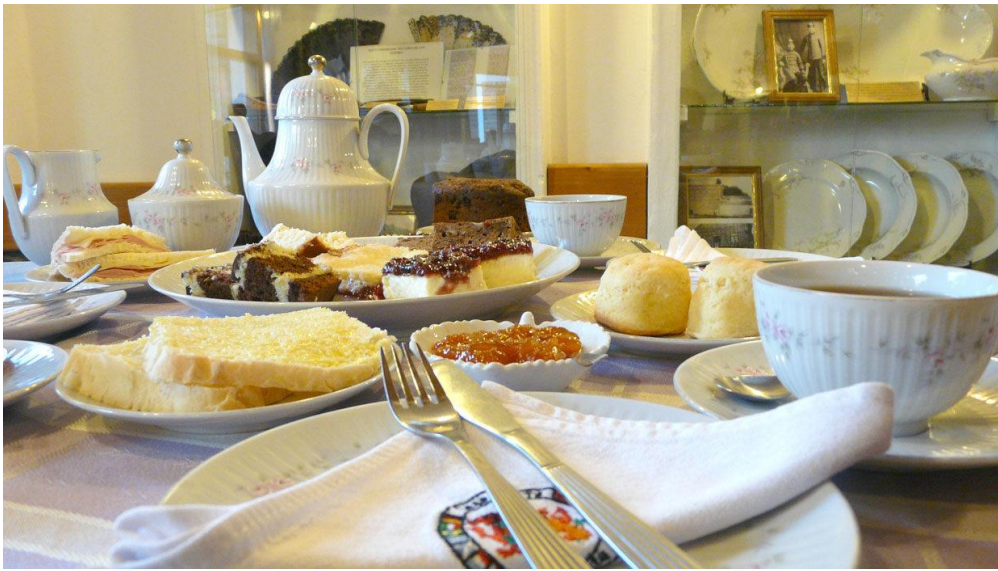
Regreso al hotel. Cena

DIA 7: Desayuno. Emprendemos el viaje de regreso visitando en camino El Parque Nacional Lago Puelo y El Bolsón.